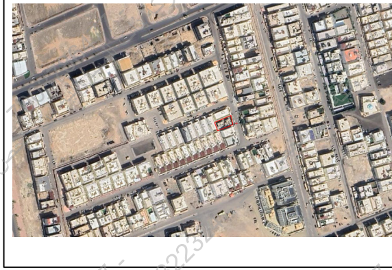
صور من الموقع