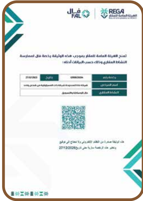
رخصة فال للوساطة العقارية