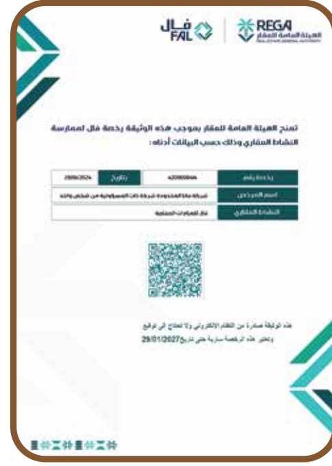
رخصة فال للمزادات