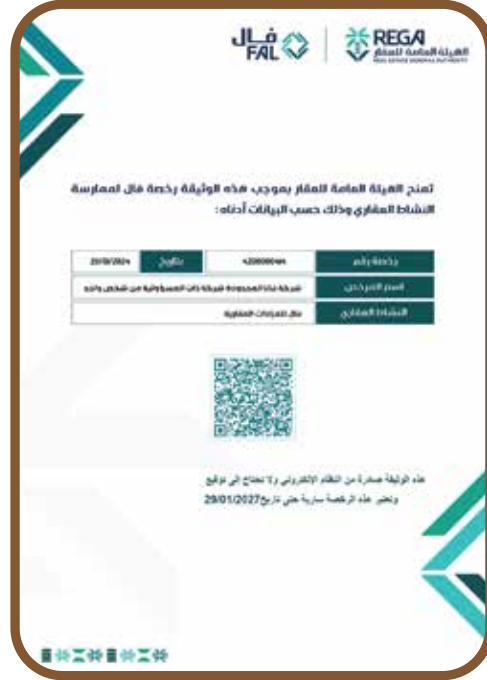
رخصة فال لإدارة الأملاك