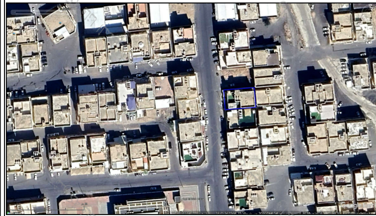
صور من الطبيعة