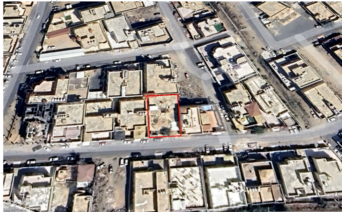
الحدود و الأبعاد و المساحة حسب تطبيق الصك