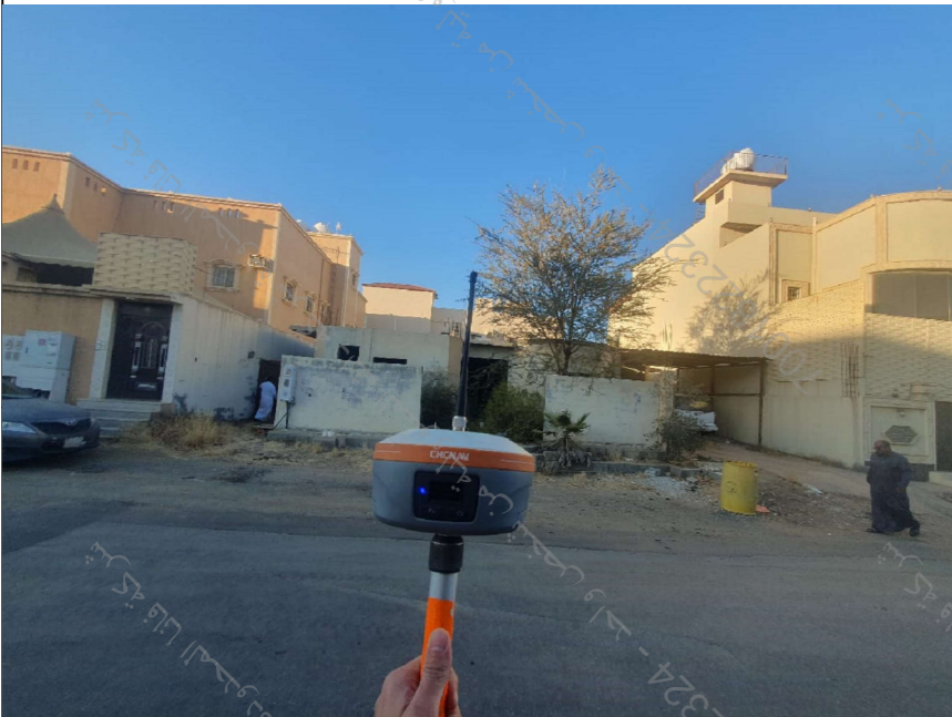
الحدود و الأبعاد و المساحة حسب الطبيعة