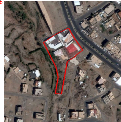
الحدود و الأبعاد و المساحة حسب تطبيق الصك