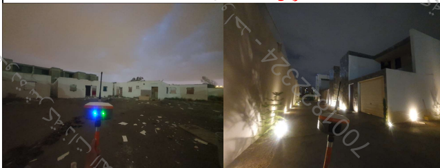
الحدود و الأبعاد و المساحة حسب الطبيعة