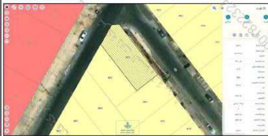
صور من الطبيعة