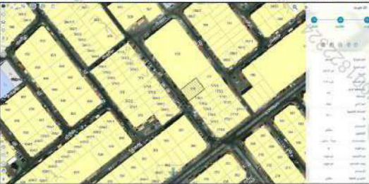
صور من الطبيعة