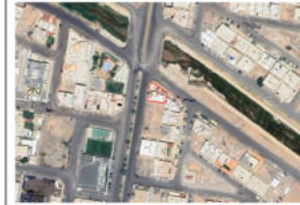
صور من الموقع