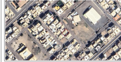
صور من الموقع